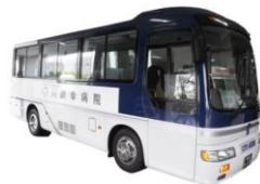
大型シャトルバス