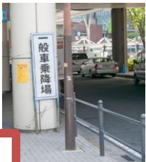
◆JR川崎駅西口シャトルバス乗り場 (両ルート共通)