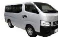
ミニシャトルバス