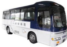
大型シャトルバス